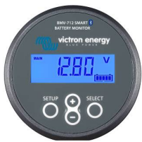
Bluetooth-Erkennung BMV-712 Smart Battery Monitor