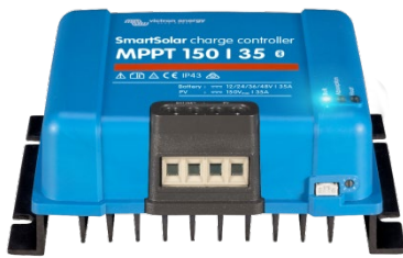
SmartSolar Lade-Regler MPPT 150/35