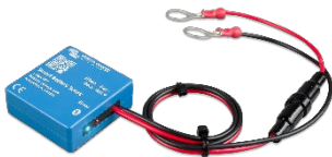
Bluetooth-Erkennung Smart Battery Sense