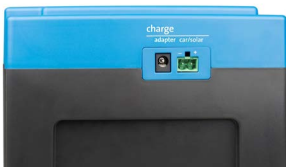
Adapter und Eingänge Fahrzeug/Solarmodul (Car/Solar) (Buchse für den Car/Solar-Eingang wird mitgeliefert)