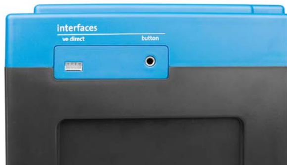
VE.Direct und Druckknopf