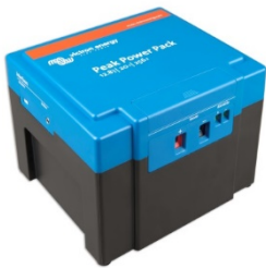
12,8 V, 20 Ah