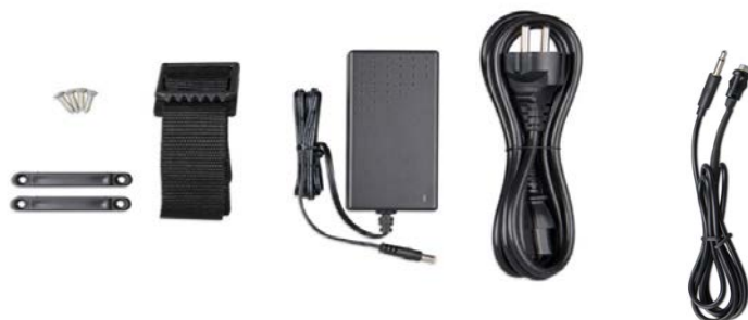
Befestigungsriemen Adapter Stromkabel Druckknopf mit Kabel (2 m) und zweifarbiger LED