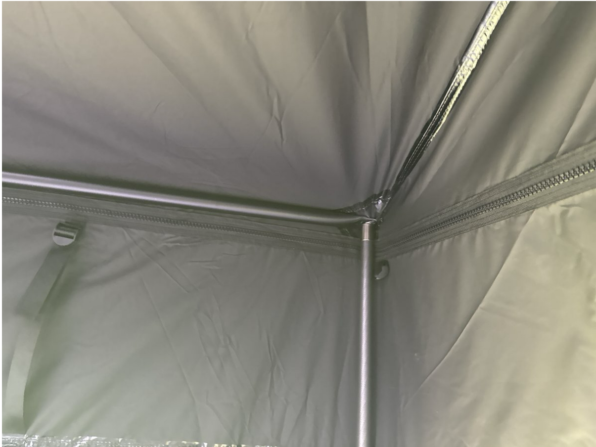
Innenecke: Querstange und Zeltstange mit Verbindungspunkt