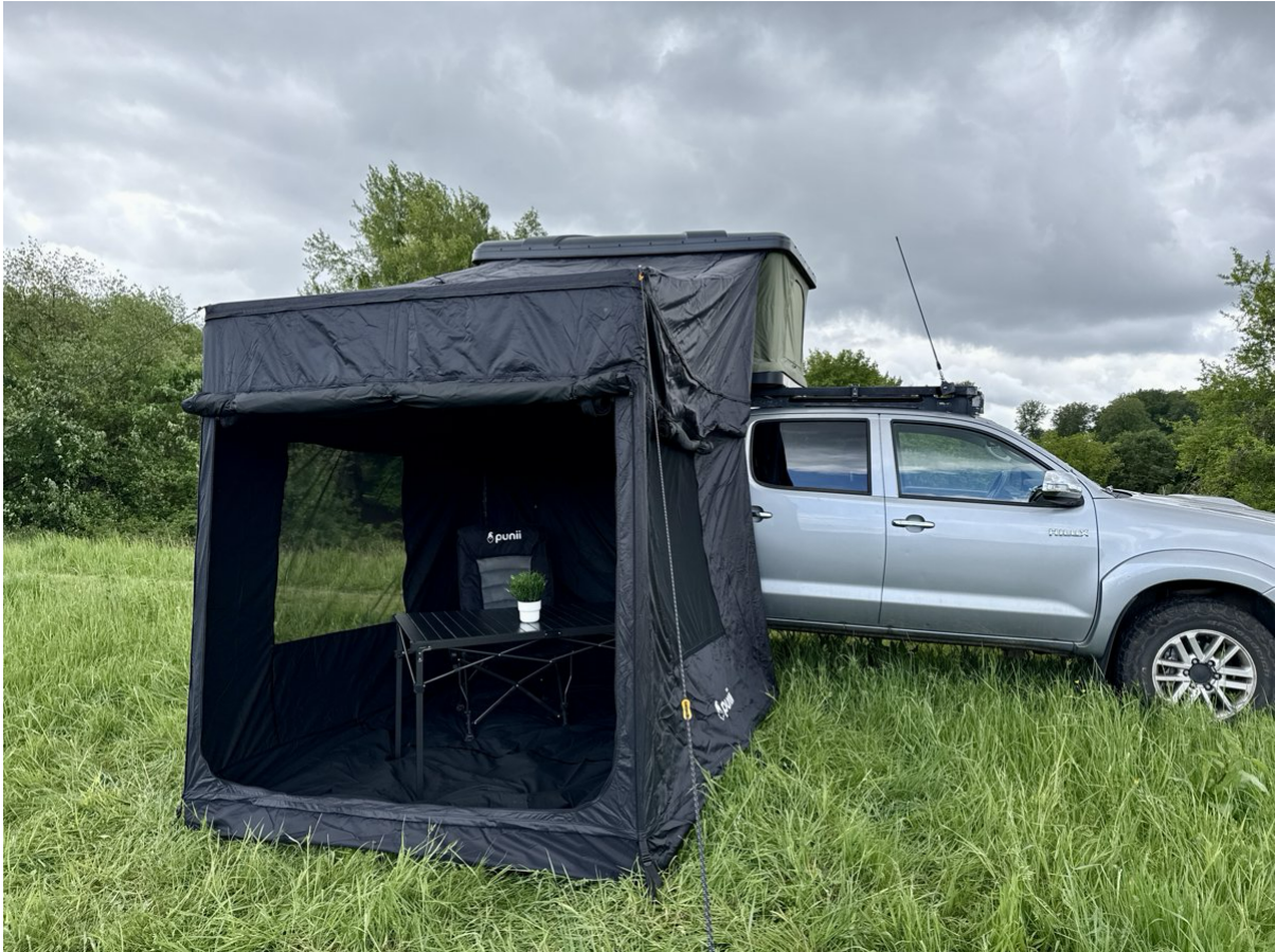
Fertig aufgebautes wahi tao S Vorzelt am Dachzelt

💡 Vor dem ersten Aufbau empfehlen wir dir einen Probeaufbau zu Hause, um alle Teile kennenzulernen.