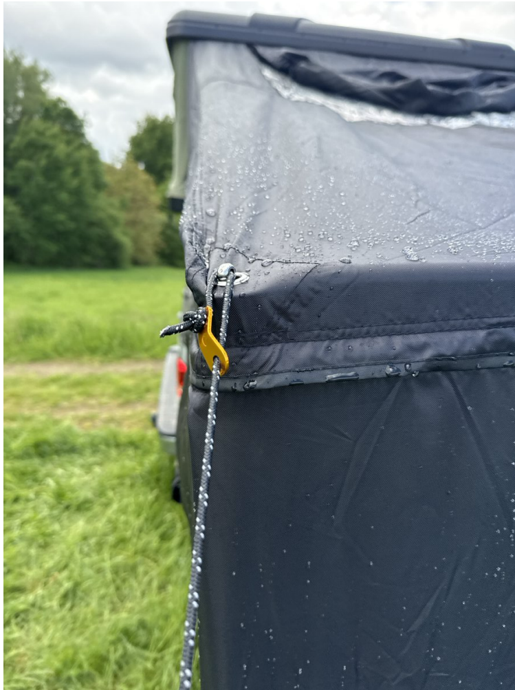
Öse mit Schraube und Spannseil (gelber Spanner) an der Außenecke