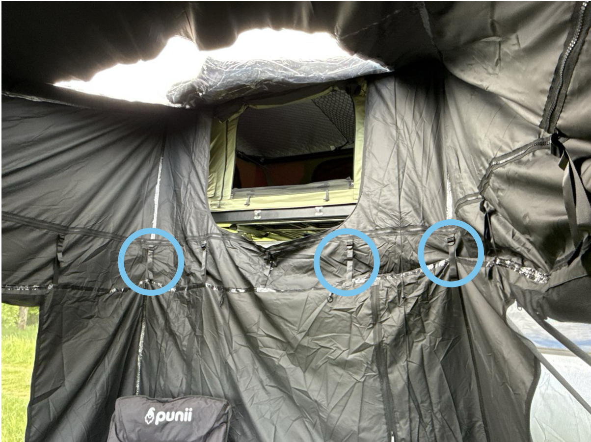
Blick von innen: Öffnung Vorzelt zum Dachzelt mit aufrollbarer Öffnung. Spannriemen zur Anpassung der Höhe (Kreis).