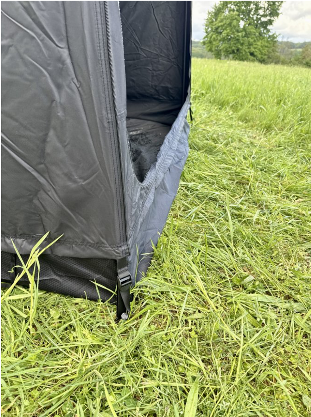
Bodenecke mit Hering und Schnalle zur Befestigung

14. Bodenfläche zur festen Seite hin aufrollen und mit Bändern sichern.