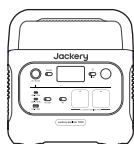
Jackery Explorer 1000